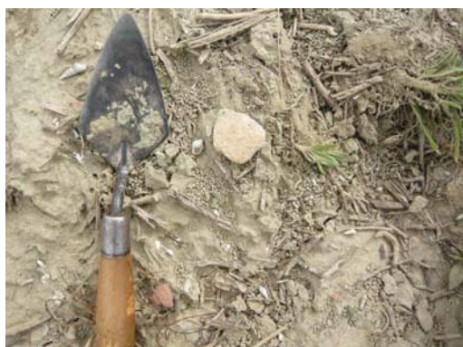
圖說：散佈於魚塢周邊的夾砂陶片