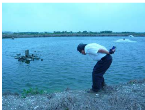
圖說：魚塢周邊可見不少貝類