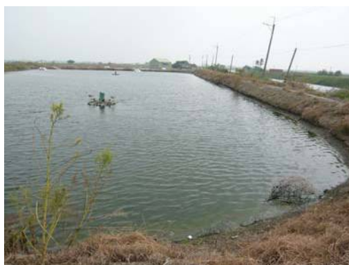
圖說：遺址所在之魚塢現況