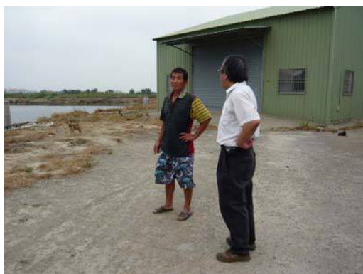
圖說：向地主詢問魚塢深開挖情況